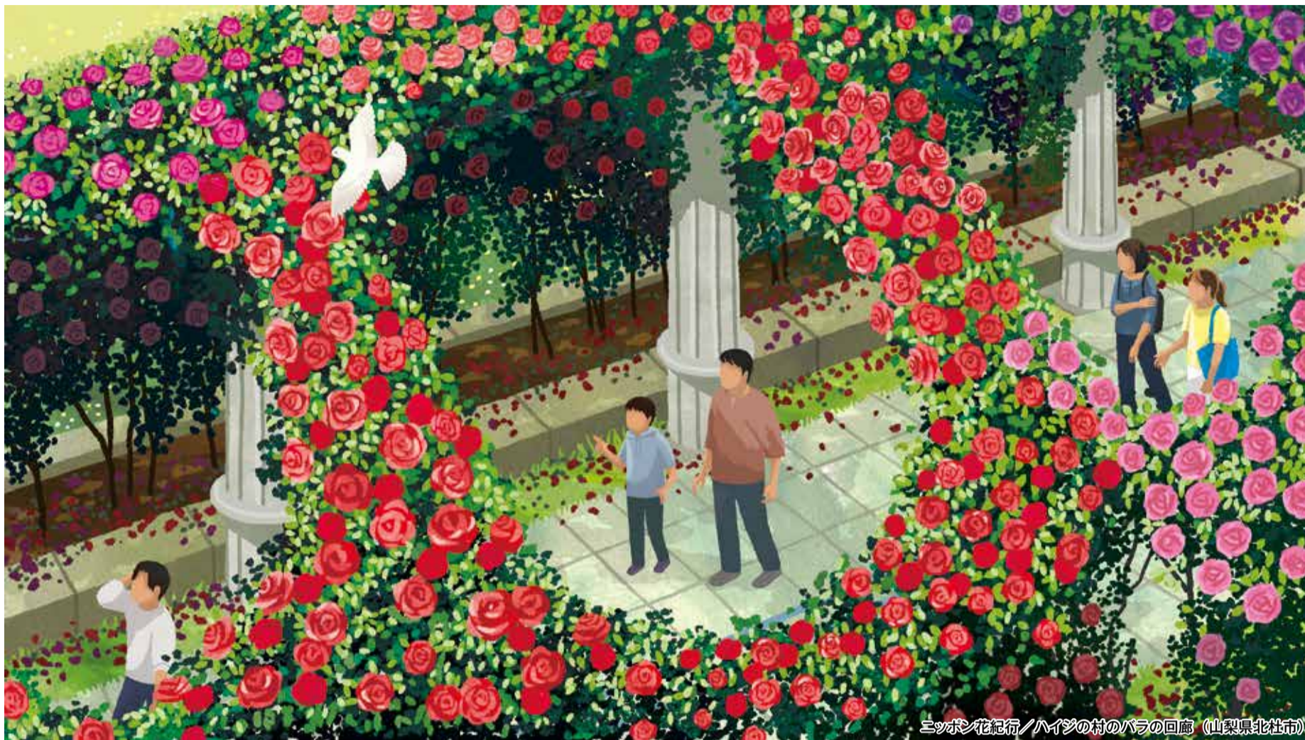
ニッポン花紀行/ハイジの村のバラの回廊 (山梨県北杜市)